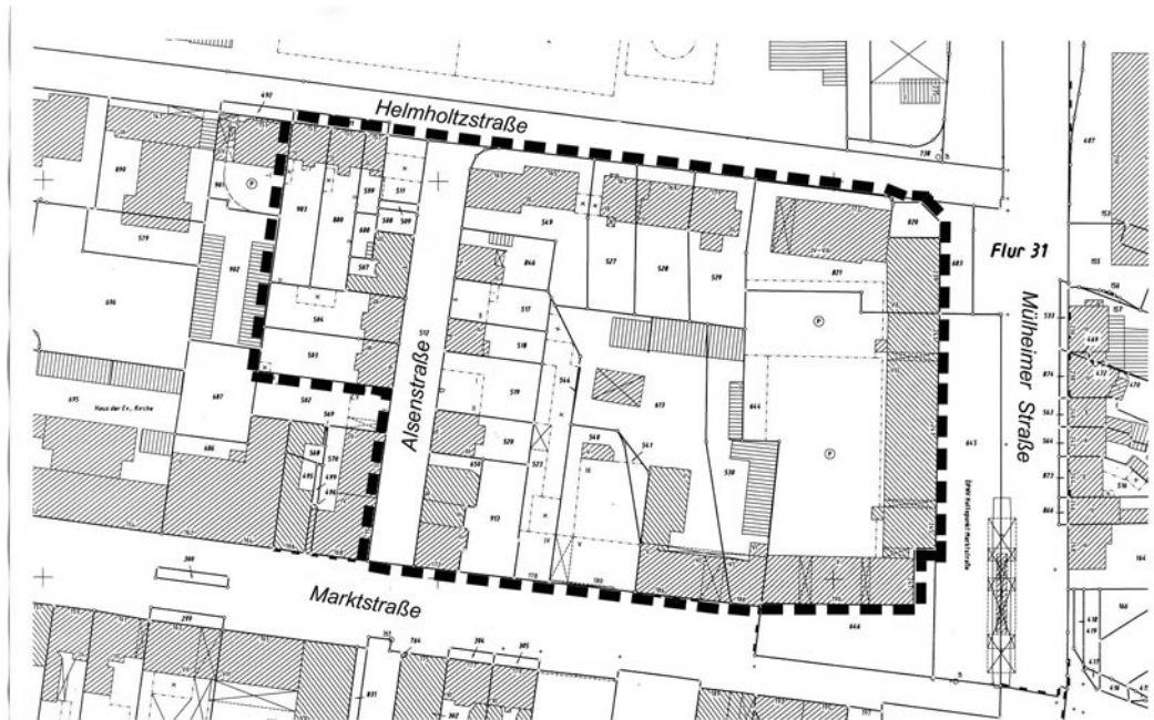
Bebauungsplan Nr. 641 Marktstraße/Helmholtzstraße/Mülheimer Straße

Der Rat der Stadt hat am 23.11.2009 die Aufstellung eines Bebauungsplans für das im Plan des Bereichs 5-1 -Stadtplanung- vom 14.10.2009 umrandete Gebiet beschlossen (Bebauungsplan Nr. 641).